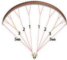
Rangées 1,2,3... Stab

Comme un instrument de musique, votre parapente doit être régulièrement accordé.